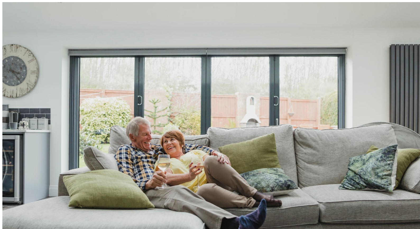
Komfortables und barrierefreies Wohnen im Alter wird zunehmend wichtiger. Die meisten Menschen möchten auch im Alter selbstbestimmt zu Hause Wohnen.